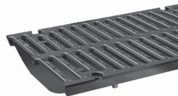
Öntöttvas rács, Oszt. F – zárt